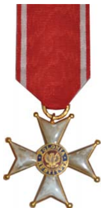
Odnaczenie 1 Krzyż Kawalerski Orderu Odrodzenia Polski