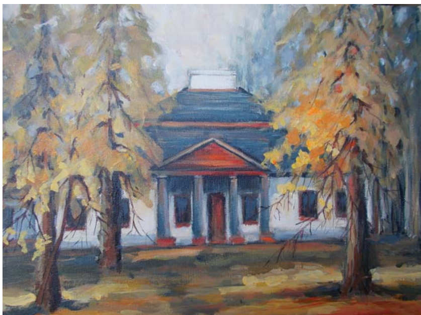
Alicja Cimek, Krupce, dwór klasycystyczny z lat 1779 – 1782, przebudowany około 1840 r. – stan obecny , 2021, akryl na płótnie, 30x40.