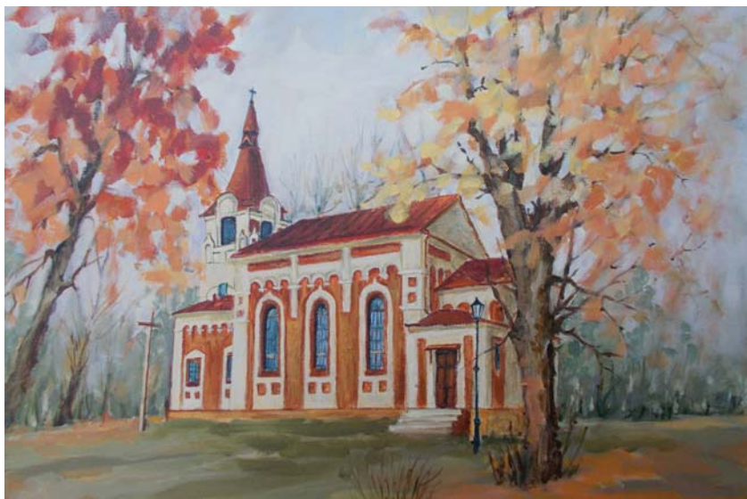
Alicja Cimek, Zabytkowy kościół pw. Matki Bożej Częstochowskiej w Krupem k/Krasnegostawu przyciąga licznych turystów i wiernych , 2021, akryl na płótnie, 50x40.