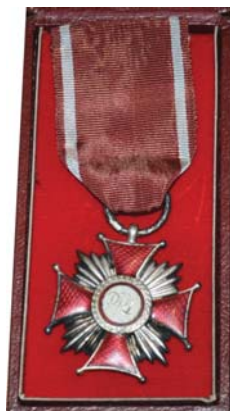
Odnaczenie 2 Srebrny Krzyż Zasługi (1972 r.)