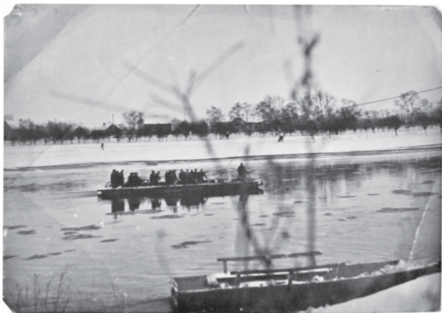
Fot. 6 Przeprowa promowa na rzece Dunajec (Komorów-Biała, lata 60.)