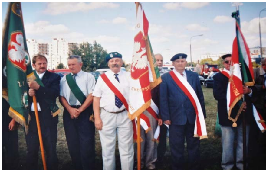
Fot. 9 Manifestacja patriotyczna Bataliony Chłopskie, PSL