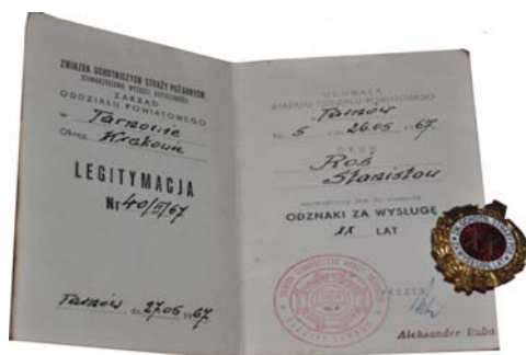
Odnaczenie 3 Odznaka za wysługę, Związek Ochotniczych Straży Pożarnych (1967 r.)