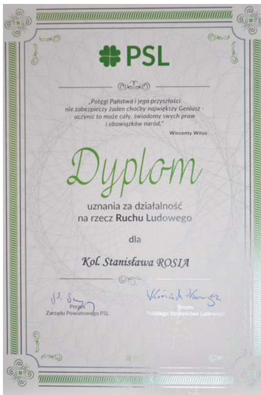
Dokument 9 Dyplom uznania za działalność na rzecz Ruchu Ludowego