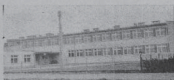
Nowo oddana szkoła w Rudce, w budowie której pomocy również Zakłady Azotowe.