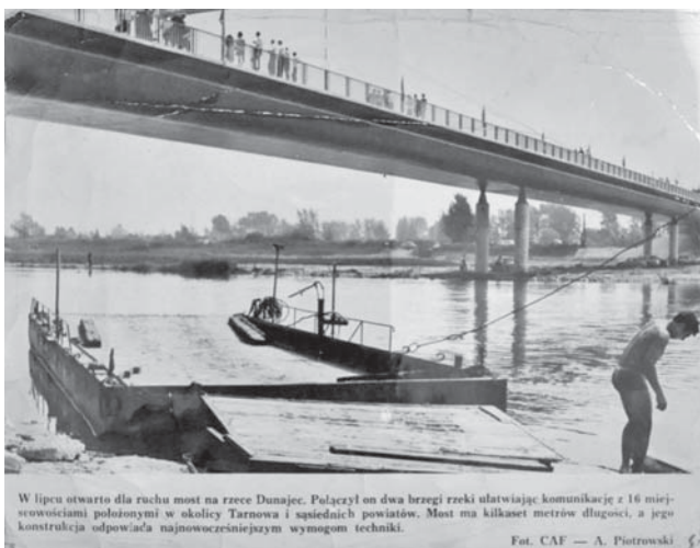
Fot. 7. Most nad Dunajcem w miejscowości Ostrow, 22 lipiec 1972 r.