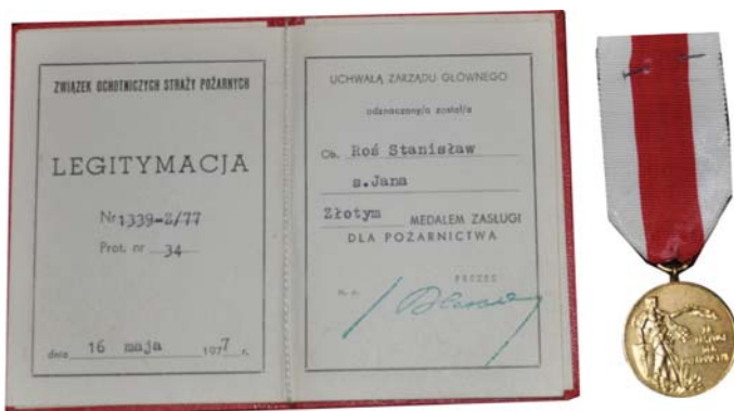
Odnieszenie 5 Złoty Medal Zasługi dla Pożarnictwa, Związek Ochotniczych Straży Pożarnych (1977 r.)