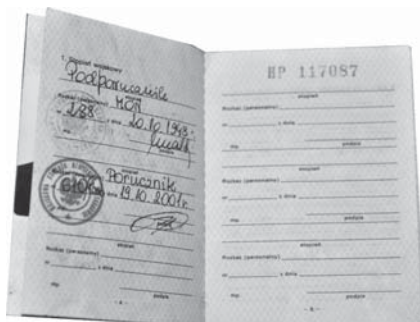
Dokument 5 Książeczka wojskowa Stanisław Zdzisław Roś (2001 r.)