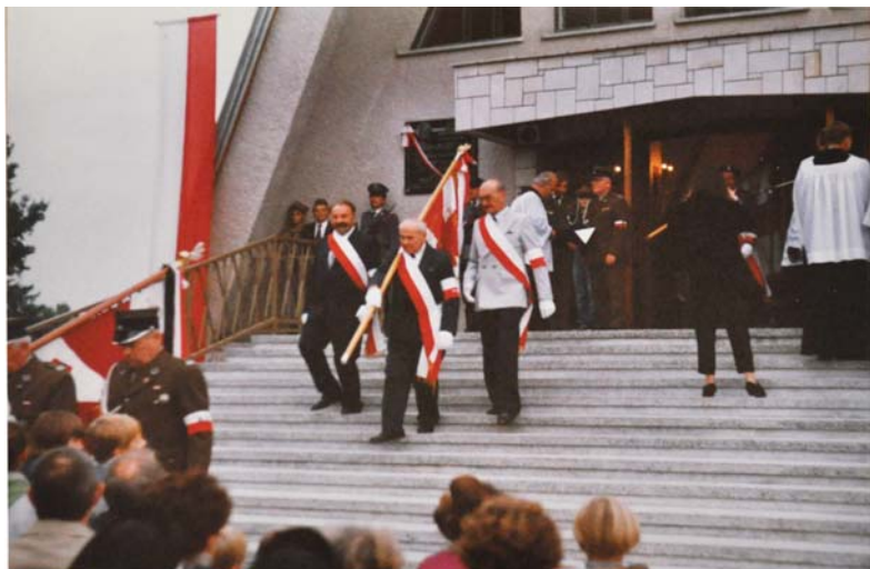
Fot. 8 Uroczystości Batalionów Chłopskich