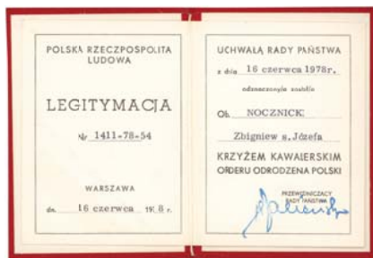
Fot. nr 6. Legitymacja Zbigniewa Nocznickiego odznaczonego Krzyżem Kawalerskim Orderu Odrodzenia Polski.