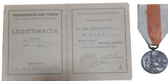
Odnaczenie 4 Srebrny Medal Zasługi dla Pożarnictwa, Związek Ochotniczych Straży Pożarnych (1967 r.)